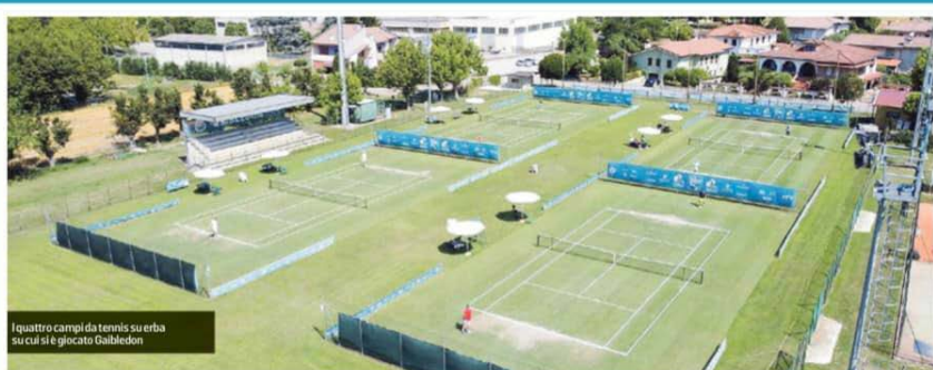
Quattro campi da tennis su erba su cui si è giocato Gaibledon