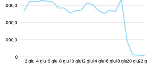
Nuovi follower di Instagram ⓘ